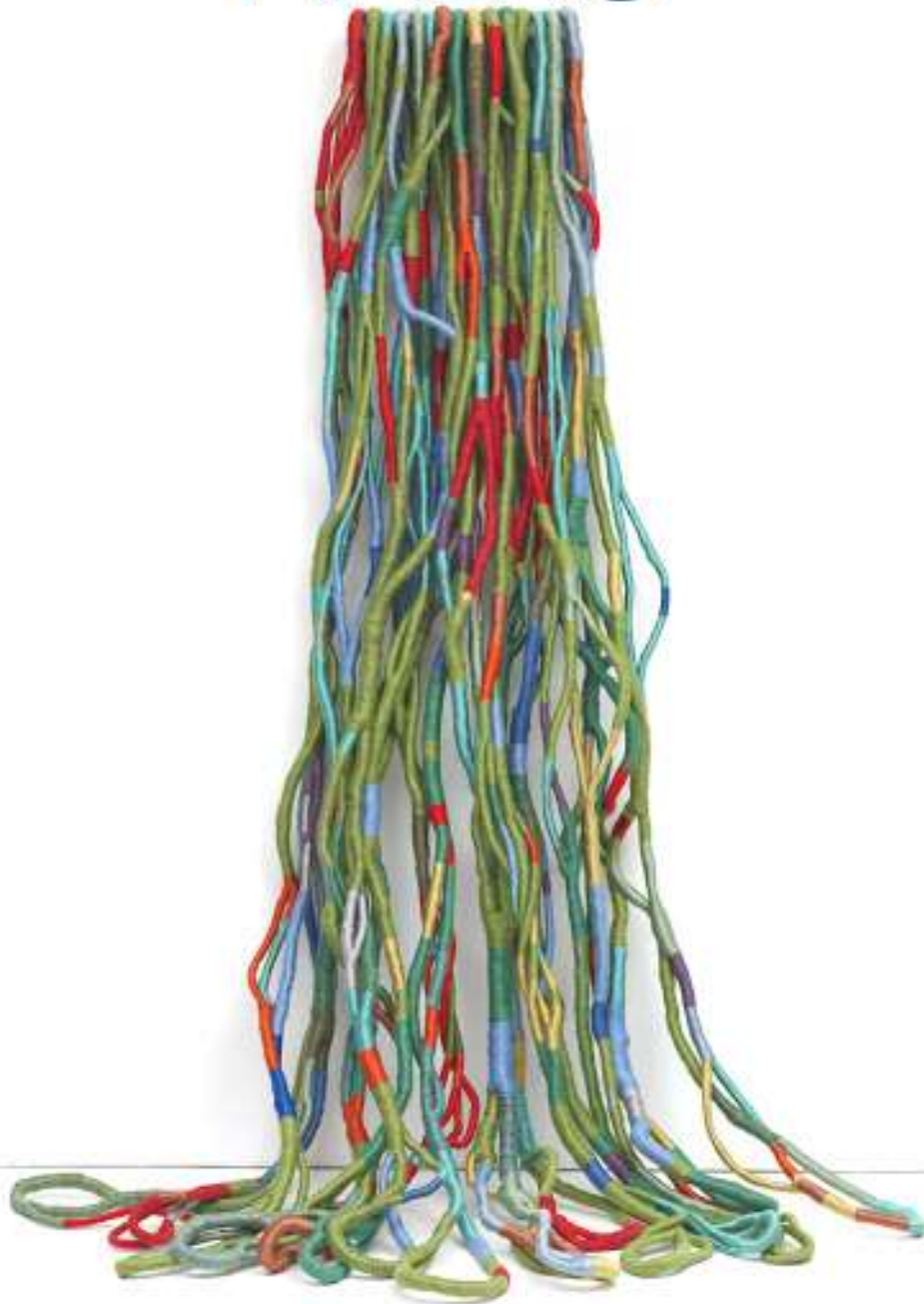
Lianes de Beauvais, 2011 Sheila Hicks, artista textil.