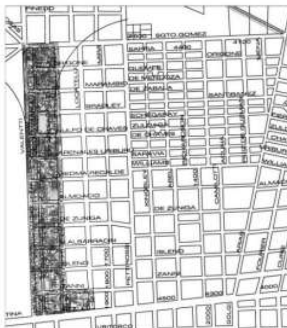
Reconstrucción de trama urbana mediante superposición de plancheta catastral y foto aérea de la villa