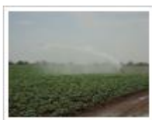
Cultivo de papa

Los habitantes de la zona son empleados jornaleros o peones rurales.