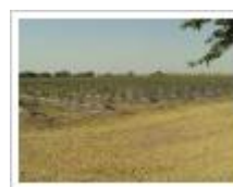
cultivo de arándanos