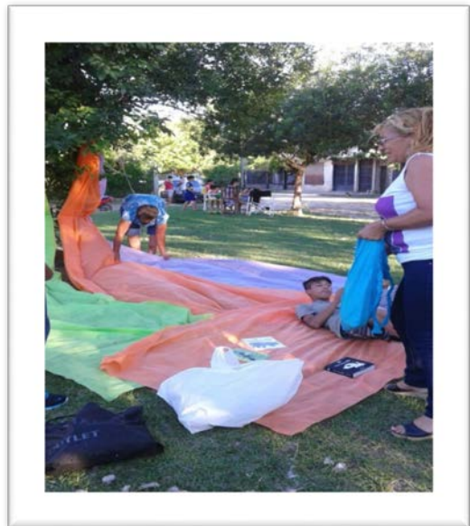
CDI : Ciclo de Lectura