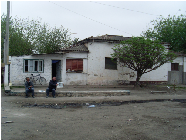
Imagen 1 - Primeras casas de la zona.