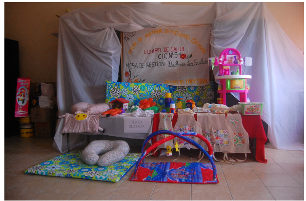
Imagen 5 – Presentación Plaza Blanda - MGL