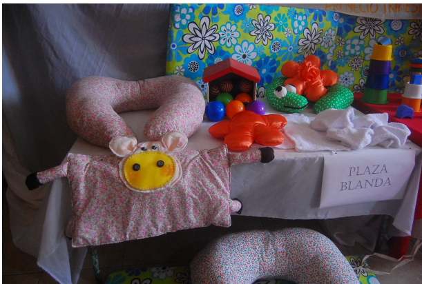
Imagen 6 – Presentación Plaza Blanda - MGL