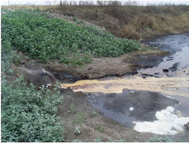
Imagen 3 - Contaminación del Ingenio I