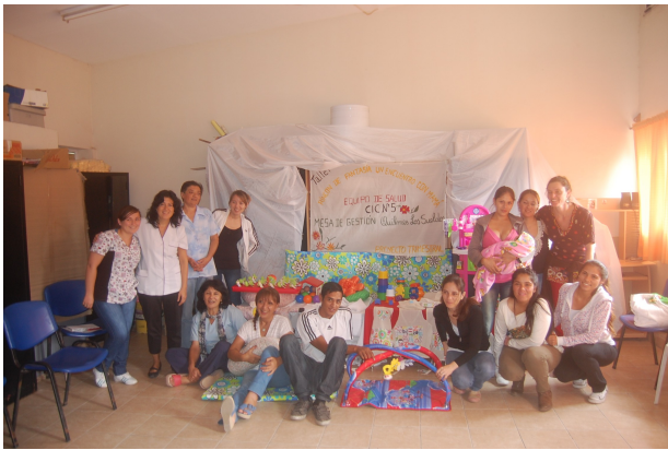
Imagen 4 – Presentación Plaza Blanda - MGL