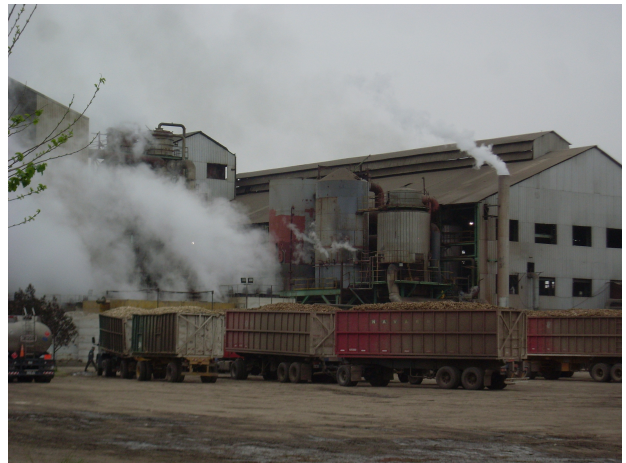
Imagen 2 - Ingenio Azucarero Leales