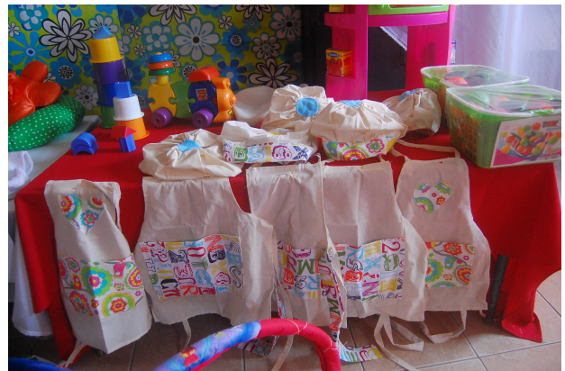
Imagen 7 – Presentación Plaza Blanda - MGL