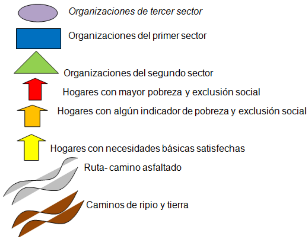
GRAFICO 1 - Referencias